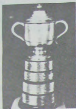
М. Свейтлинг кубок