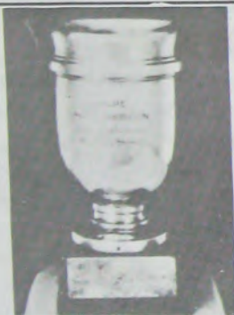
М. Корбийона кубок