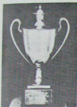
Ваза Св. Брайды

1/8 финала: Я.-У. Вальднер (Швеция) — Й.Росскопф (Германия) 3:0 (18,17,18)