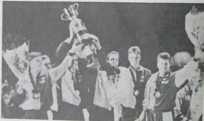
Чемпионы мира — мужская команда Швеции.

Я считаю выступление мужской сборной страны неудовлетворительным. До него, видимо, ничего не надо было менять в процессе подготовки и команда сыграла бы лучше. Но когда-то все же надо было менять. Разговоры о том, что весь мир тренируется в домашних условиях, не поддерживают, на мой взгляд, критики. Что же,